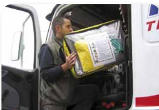
Комплект ADR для сбора проливов