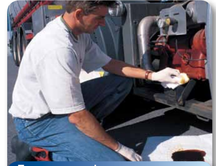
Только для нефтепродуктов и маслопродуктов