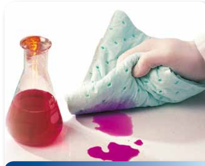
Для химических веществ