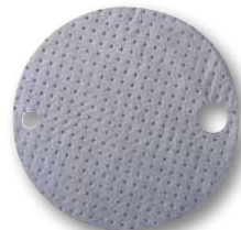
Прокладки под крышки бочек